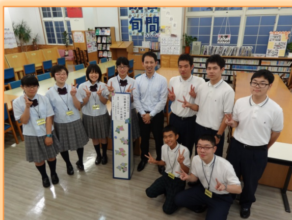
大波先生と図書部全体役員