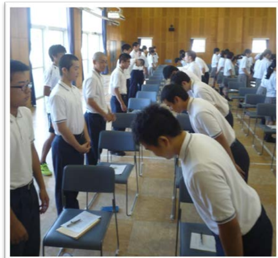
お互い向かい合い、お辞儀の練習