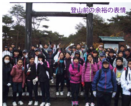
登山前の余裕の表情

今回の助け合う心や、過酷さを喜びに変える力を今後の生活に活かしてもらいたいと願っています。