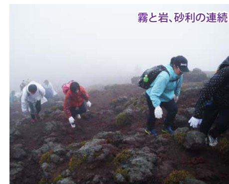
霧と岩、砂利の連続