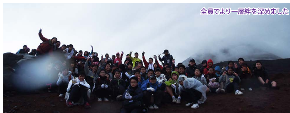
全員でより一層絆を深めました