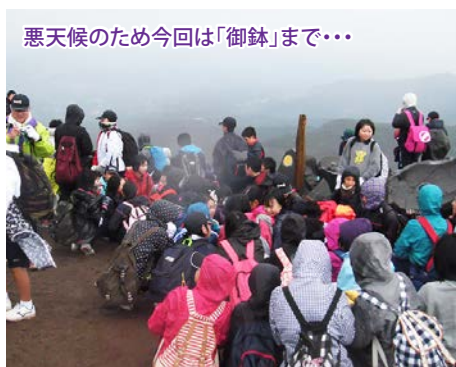
悪天候のため今回は「御鉢」まで……