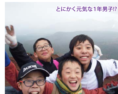
とにかく元気な1年男子!?