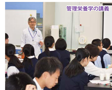
管理栄養学の講義