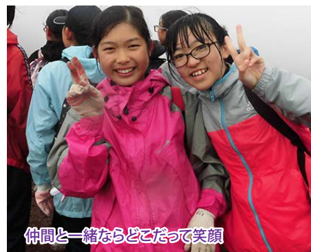
仲間と一緒にならどこだって笑顔