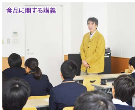
食品に関する講義

小雨の降るあいにくの天気の中での校外学習となりましたが、3年生にとっては、大学への進学意欲や科学的な興味・関心を刺激される良い機会となりました。