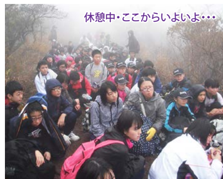
休憩中・ここからいよいよ……