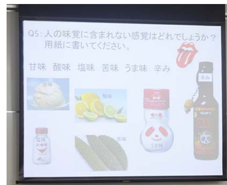
Q5: 人の味覚に含まれない感覚はどれでしょうか？ 用紙に書いてください。