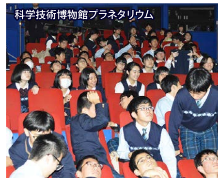
科学技術博物館プラネタリウム