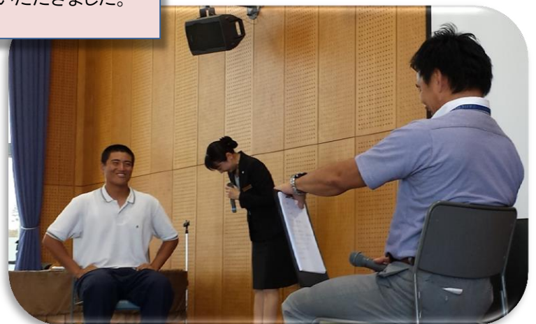
ロールプレイングしている様子