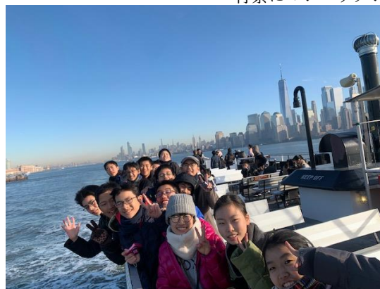
背景にマンハッタン

第25期生のアメリカ修学旅行が行われました。世界の政治の中心地ワシントンD.Cと経済の中心地ニューヨークを経験することによって世界を体感し、異文化を理解し、国際的な視野を育て、将来に生かすことを目的として一中の2年生で行われる伝統行事です。