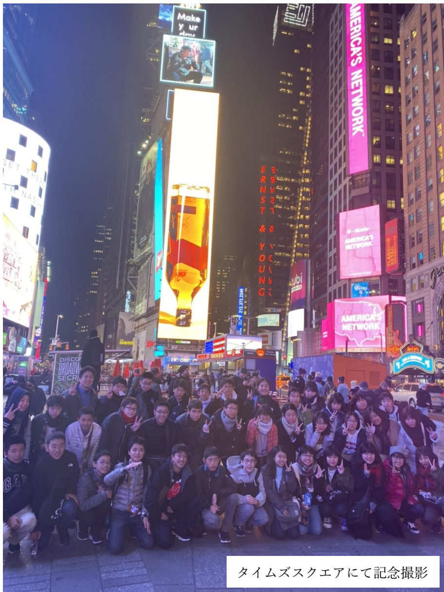
タイムズスクエアにて記念撮影