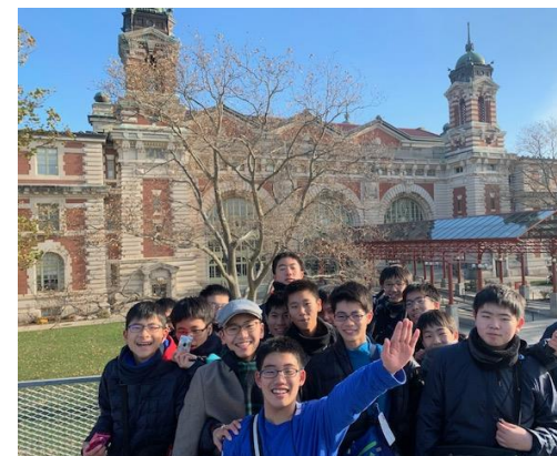
一生の思い出となる一中の修学旅行

「日米の文化の違いに気付き、改めて日本文化について考える。」等々様々なことに気付き、学びを深める1週間となりました。