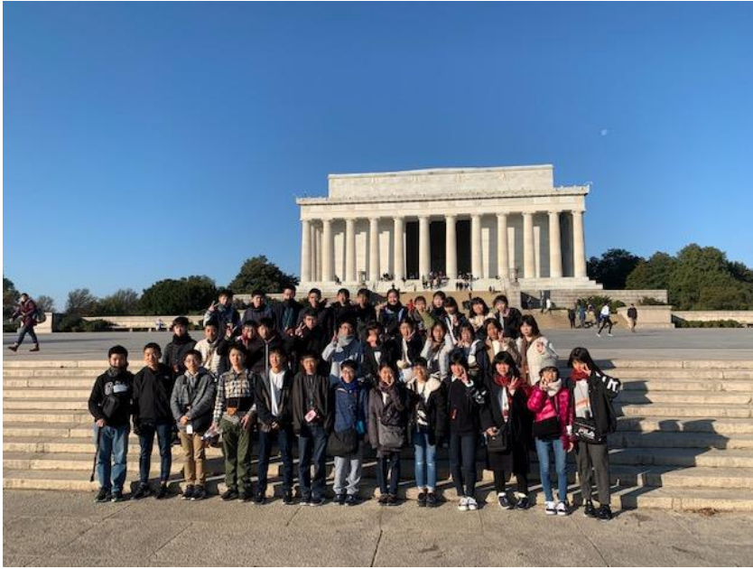
リンカーン記念堂前で記念撮影