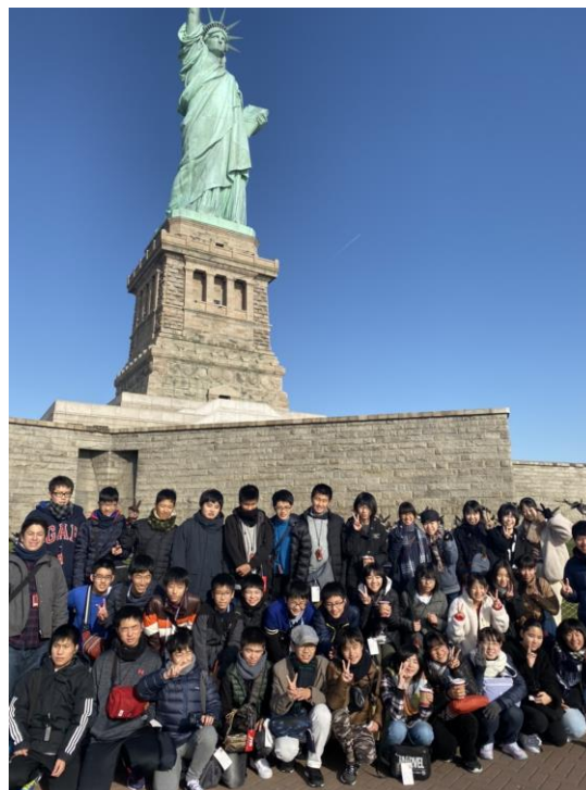
「自由の女神」像にて記念撮影