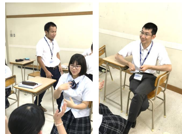
英語科の先生もお手伝いに！