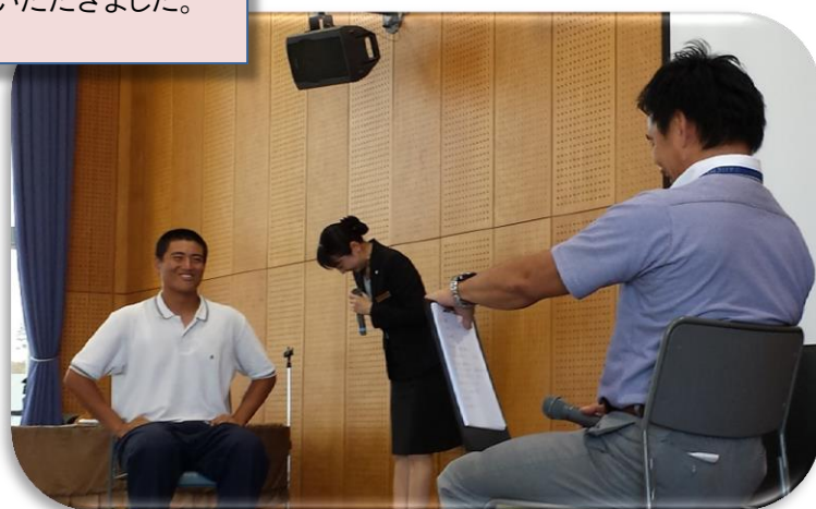
ロールプレイングしている様子