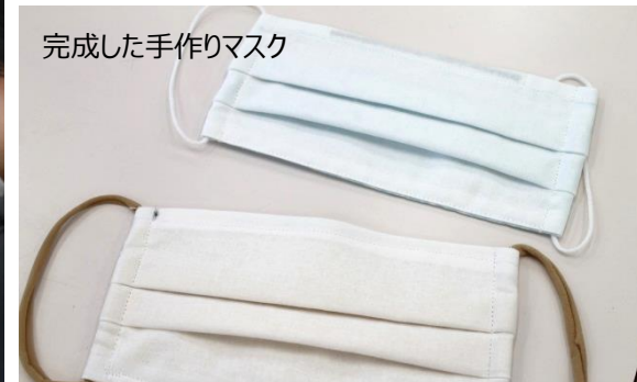
完成した手作りマスク