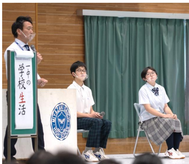
島田先生と一中生による学校紹介