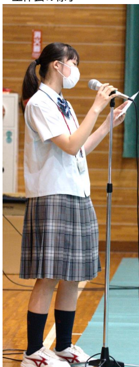
全体会の司会も一中生