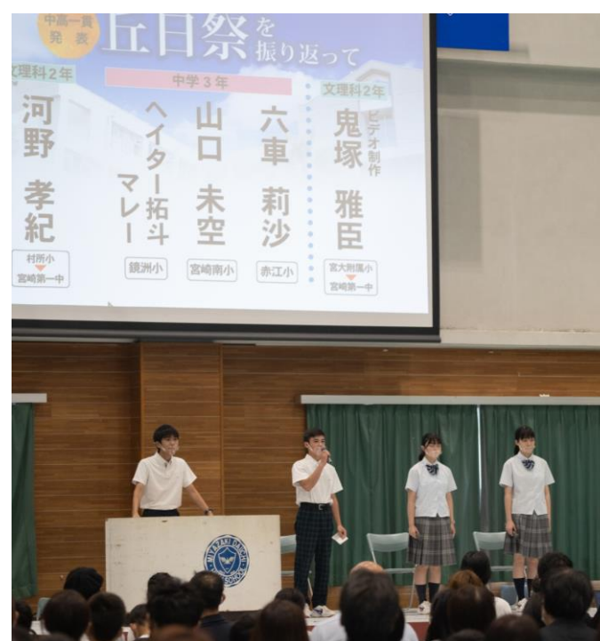
生徒による丘日祭の発表