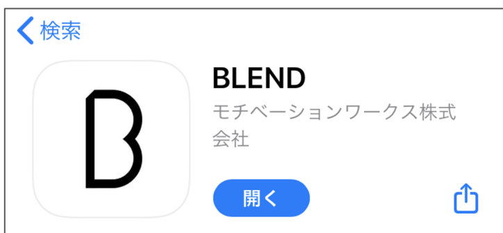
App Storeからインストールをお願いします