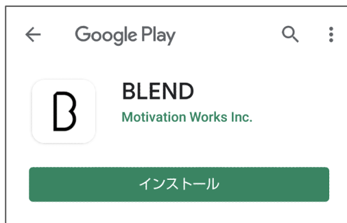
Google Play画面からインストールをお願いします