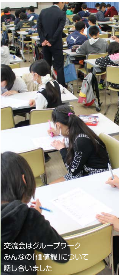
交流会はグループワーク みんなの「価値観」について 話し合いました