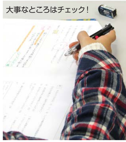
大事なところはチェック!

3月7日(土)に第2回入学準備学習会を実施しました。生憎の雨となりましたが、今回もたくさんの児童が参加してくれました。授業開始前の【予鈴・着席】も定着し、授業をスムーズに始めることができました。入学後も継続してやっていきましょうね! 交流会では、「将来の目標や夢がある人」と、尋ねるとほぼ全員が手を挙げてくれたので、思わず先生も「おお、すごい」と驚いていました。皆さんの夢・目標達成のために教職員一同しっかりと指導していきます! 一緒に目標に向かってがんばりましょう! 保護者の皆様、雨の中の送迎、本当にありがとうございました。