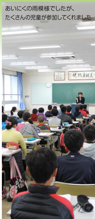
あいにくの雨模様でしたが、 たくさんの児童が参加してくれました