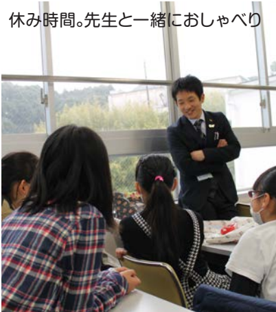
休み時間。先生と一緒にしゃべり